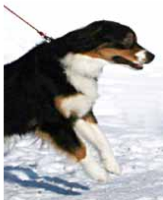
Kopplet begränsar hundens förmåga att kommunicera

En hund som däremot vill minska avståndet, eller lugna den man möter (eller sig själv i stressande situationer) har en mängd beteende att ta till: Lekinviden med framdelen på huk och tassarna brett isär förstår de flesta, liksom den glatt, snabbt viftande svansen. Men även att lyfta på tassarna, vända bort blicken, sätta eller lägga sig ned, nosa på marken samt att slicka sig runt munnen är exempel på signaler avsedda för att visa att man är vänligt inställd.